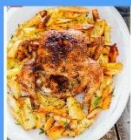
Roasted chicken with baked potatoes