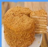
Honey cream cake