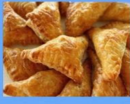
Cheese pockets (Bereg)