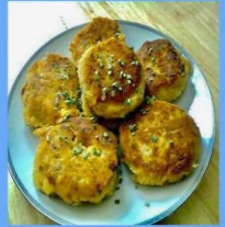
Potato patties with meat filling and vegetables