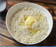
Harissa (porridge with chicken and wheat)