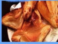
Khachapouri (Halloumi and Mozzarella filled bread)