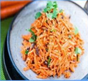
Carrot salad with pomegranate and apple