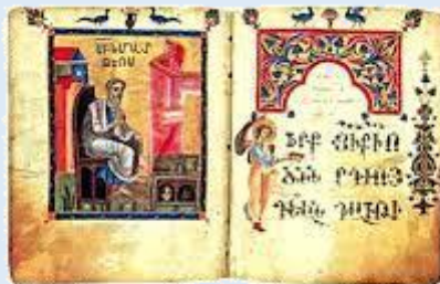
Ավետարան ըստ Մատթեոսի - Գլուխ 15

Or quand l'esprit immonde est sorti d'un homme, il va par des lieux secs, cherchant du repos, mais il n'en trouve point. Et alors il dit : je retournerai dans ma maison, d'où je suis sorti; et quand il y est venu, il la trouve vide, balayée et parée. Puis il s'en va, et prend avec soi sept autres esprits plus méchants que lui, qui y étant entrés, habitent là; et ainsi la fin de cet homme est pire que le commencement; il en arrivera de même à cette nation perverse.