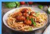
Meatballs with pasta