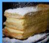
Napoleon Masks are mandatory & keep 2 meter distance !

For your orders please call Parandzem (514)792-2866, Choghig (514)929-6272 Saint Gregory Armenian Apostolic Church of Montreal 615 Avenue Stuart Outremont, QC H2V 3H2