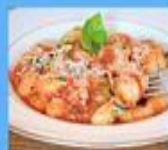
Gnocchi ala Gigi