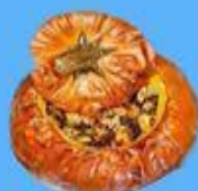
Ghapama (Vegetarian Arm. meal)