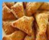
Cheese pockets (Bereg)