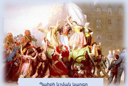
Պահքի նշման կարգը

Մինչ Չատիկէն առաջ՝ Հայ Եկեղեցին 40 օր պահք կը տնօրինէ, Յիսնակաց պահքը կը վերածուի միայն 5 օրուայ, սկսելով առաջին երկուշաբթիէն մինչեւ ուրբաթ օրը: Յիսնակաց շրջանի մնացեալ բոլոր օրերը կարելի է սուրբերու տօնակատարութիւն ընել, եւ պահք ու ծոմ չընել: