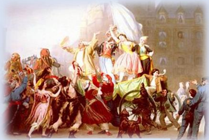
Պահքի նշման կարգը

Մինչ Զատիկէն առաջ՝ Հայ Եկեղեցին 40 օր պահք կը տօնօրինէ, Յիսնակաց պահքը կը վերածուի միայն 5 օրուայ, սկսելով առաջին երկուշաբթիէն մինչեւ ուրբաթ օրը: Յիսնակաց շրջանի մնացեալ բոլոր օրերը կարելի է սուրբերու տօնակատարութիւն ընել, եւ պահք ու ծմբ բռնել: