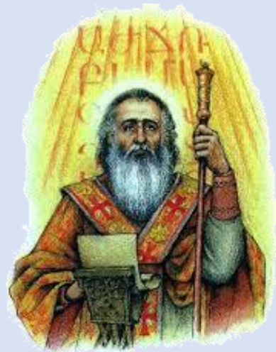
Ս.ՍԱՀԱԿ Ա ՊԱՐԹԵՎ 387 - 436