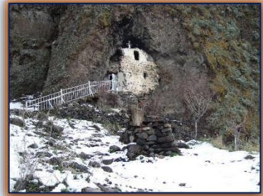
Արայի Լեռ Վարվառէ Կոյսին Գերեզմանը

օրը կը կոչէին «Ծաղկամօր Կիրակի»: Ծաղկամայրը ըստ աւանդութեան Քրիստոնեայ Վարվառէ կոյսն է, որ փախչելով կռապաշտ հօրմէն, կ'ապաստանի Աշտարակի մօտ գտնուող Արայի լեռնայն քարանձախն մէջ: Հայրը կը հետապնդէ աղջկան, կը գտնէ եւ կը սպաննէ անոր: Նահատակուելէն առաջ Վարվառէն Աստուծմէ կը խնդրէ, որ ծաղիկ եւ կարմրուկ հիւանդութիւններ ունեցող մանուկները բժշկուին իր անունով: Աստուած կը կատարէ անոր խնդրանքը, եւ Վարվառէին բարեխօսութիւնը ինդրող ծնողներու գաւակները կ'ազատուին այդ հիւանդութիւններէն: Այդ քարանձախը կը դառնայ ուխտատեղի: Քարանձախ պատերէն մշտապէս ջուր կը հոսի, որ ունի բուժիչ յատկութիւն: Ժողովուրդը հաւատացած է, որ այդ ջուրը Վարվառէ կոյսին արցունքներն են: