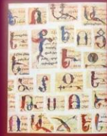
Dora Sakayan 2 500 proverbes arméniens traduits en français